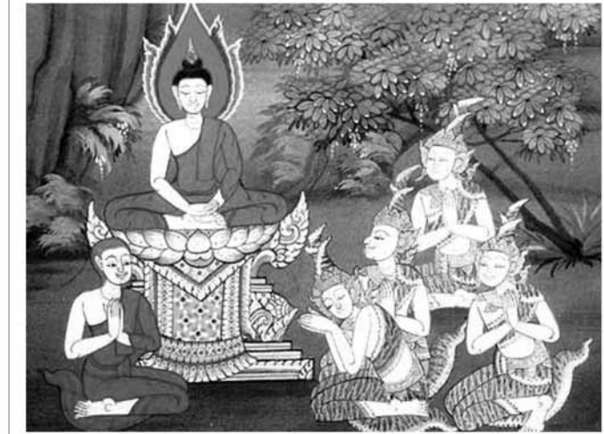
ทรงแสดงพระปฐมเทศนา

ลัทธิวรกทั้งสี่ยังเสวยความทุกข์อยู่ที่นั่น ฯลฯ ความรู้เหล่านี้เป็นเพียงความจำที่เรียกว่า สัญญา เกิดขึ้นได้เนื่องจากมีผู้รู้ได้จดบันทึกไว้เป็นหลักฐาน ซึ่งยังไม่แน่ว่าเป็นเรื่องที่เกิดขึ้นจริงหรือไม่ ด้วยเหตุนี้พระพุทธรูปจึงได้ตรัสกับชาวกาลามะ แห่งเกสปุตนิกม แคว้นโกศล ไม่ให้เชื่อเรื่องที่ไม่มีเหตุผลรองรับ (กาลามสูตร) รวมได้สิบอย่างว่า ผู้ใดได้ยินได้ฟังคำบอกเล่าที่ออกจากปากของบุคคลแล้ว อย่าพึงปลงใจเชื่อตามหลักวินิจฉัย (หลักเกณฑ์) สิบอย่างดังนี้