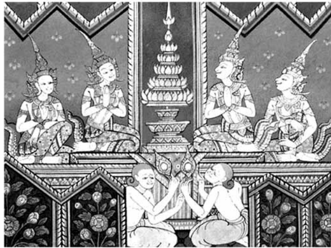
พระพุทธรูปบิดาและพุทธมารดาในพิธีอภิเษกสมรส เจ้าชายสุทโธทนะ และเจ้าหญิงมัทมายา เข้าสู่พิธีอภิเษกสมรส ณ อโศกอุทยาน