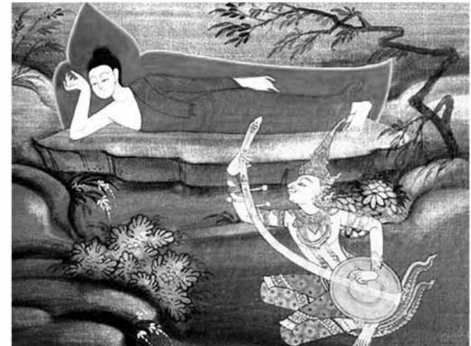
พินสามสาย

เมื่อไม่พอพระทัยด้วยอุตมคติและข้อปฏิบัติของดาบสทั้งสอง เจ้าชายจึงทรงแสวงหาบรรดาด้วยพระองค์เอง โดยทรงบำเพ็ญตะบะ ทรมาณพระองค์ มีพระภิกษุเบญจวัคคีย์คอยปฏิบัติ