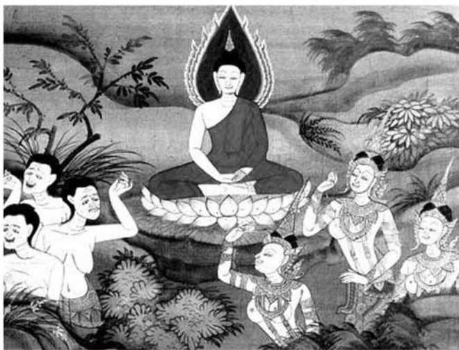
ธิดาพญามาร

นายโสติดิยะ คนทาบหญ้า ๘ ฟอนแต่เจ้าชาย ทรงนำไปเกลี้ยได้ไม้โพธิ์ และประทับนั่งบนนั้น ผินพระพักตร์ไปทางทิศตะวันออก ด้วยการปฏิบัติบำเพ็ญทางจิต ก็ได้ทรงบรรลุพระอนุตรสัมมาสัมโพธิญาณ (คือ พระปัญญาตรัสรู้เองโดยชอบ อำนวยอดเยี่ยม) ในเวลารุ่งอรุณ วันวิสาขปุณณมี