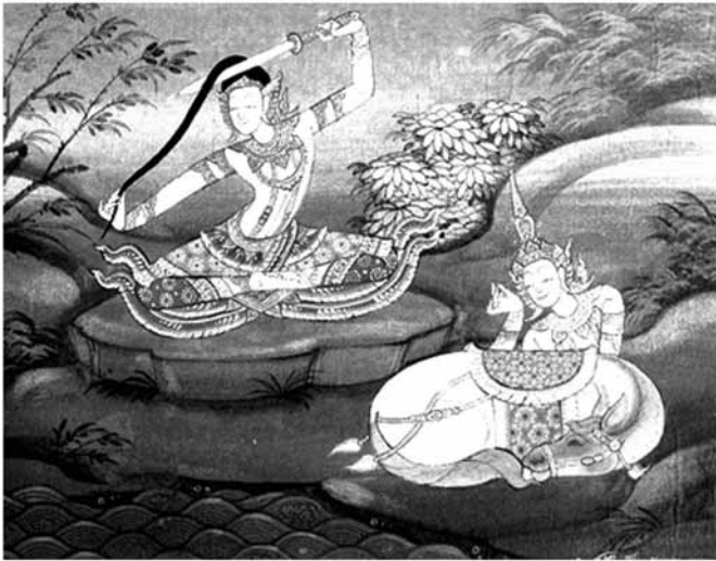
เจ้าชายทรงตัดพระเมาลี

เมื่อเสด็จถึงฝั่งแม่น้ำโนมา เจ้าชายทรงตัดพระเมาลีด้วยพระขรรค์