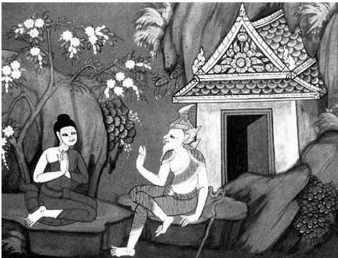
ทรงแสวงหาโมกขธรรม คือ ความหลุดพ้น

เมื่อเสด็จถึงฝั่งแม่น้ำโนมา เจ้าชายทรงตัดพระเมาลีด้วยพระขรรค์