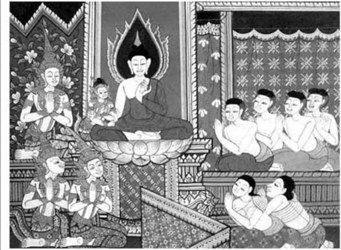
เสด็จเยือนพระชายาและพระโอรส

การปฏิบัติสองเรื่อง คือ ปฏิบัติสมถภาวนา จนจิตเข้าถึงความตั้งมั่นเป็นสมาธิ ระดับที่จะนำไปใช้เป็นฐานปฏิบัติวิปัสสนาภาวนา จนเกิดปัญญาเห็นแจ้งได้แล้ว จึงจะรู้เห็น เข้าใจ ความเป็นจริงแท้ในสิ่งที่พระพุทธรูปตรัสไว้ในกาลามสูตร ว่าสามารถใช้เป็นหลักในการประเมินความเห็นถูกตามธรรม หรือความเห็นผิดไปจากธรรมของบุคคลได้ ผู้ใดมีความเห็นถูกๆ ย่อมเข้าใจความจริงที่ระบอบอยู่ภายใต้หัวข้อประเมินชีวิตด้วยปัญญา เมื่อใช้ความเห็นถูกๆ นำพาชีวิตให้ดำเนินไป ย่อมไม่มีอุปสรรคขัดขวาง และไม่มีปัญหาให้ต้องแก้ไข ตรงกันข้าม ผู้ใดมีความเห็นผิดไปจากความเป็นจริงแท้ที่ระบอบไว้ การดำเนินชีวิตย่อมมีอุปสรรคขัดขวาง และมีปัญหาให้ต้องแก้ไข ซึ่งผู้อ่านบทความสามารถใช้เป็นมาตรวัดความเห็นของตัวเองได้ ว่าเห็นผิดไปจากความเป็นจริงหรือเห็นถูกตามความเป็นจริงแท้ ไม่ว่าผลการประเมินจะออกมาในรูปใด ผู้อ่านจะปรับแก้ไขความเห็นของตน หรือว่าจะดำเนินตามความเห็นของตนต่อไป ย่อมเป็นสิทธิ์เฉพาะตนที่ทำได้ ผู้รู้ไม่มีสิทธิ์เข้าไปก้าวล่วงในชีวิตของผู้ใด แต่หากเห็นผิดแล้วนำตัวเอง (หงายภาชนะ) เข้ามารองรับคำบอกกล่าวที่ถูกตรงตามธรรม แล้วนำไปปรับแก้ไขให้ถูกตรงได้แล้ว ชีวิตย่อมดำเนินไปสู่ความสวัสดิ์