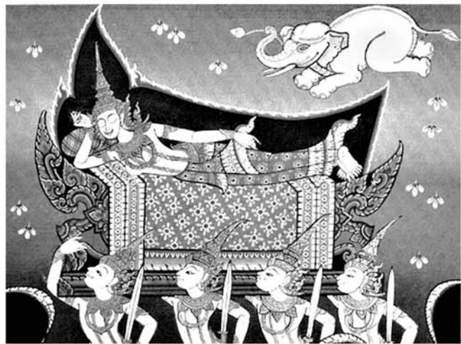
พระนางมัทมายาทรงพระสุบิน พระนางมัทมายาทรงพระสุบินว่า ลูกช้างเผือกเข้าไปสู่พระครรภ์ของพระนาง ตั้งแต่นั้นมาก็ทรงพระครรภ์