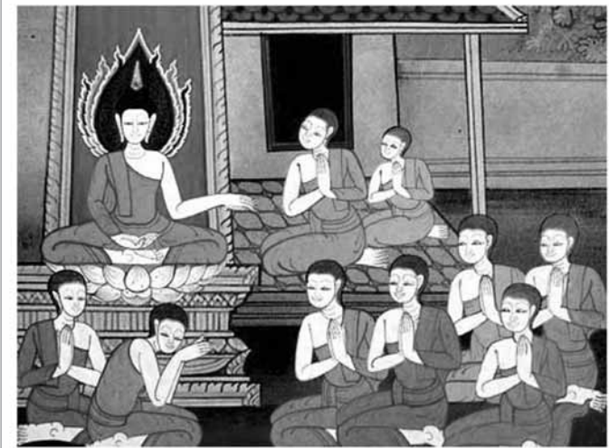
พระประยูรญาติเจริญรอยตามพระยุคลบาท

เมื่อประทับอยู่ ณ กรุงบิลพัสดุ์ พระพุทธเจ้าได้เสด็จเยือนพระชายาคือ พระนางยโสธรา และพระโอรส คือ พระราहुล