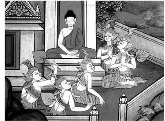
เจ้าชายทรงบำเพ็ญทุกรกิริยา

เมื่อไม่พอพระทัยด้วยอุตมคติและข้อปฏิบัติของดาบสทั้งสอง เจ้าชายจึงทรงแสวงหาบรรดาด้วยพระองค์เอง โดยทรงบำเพ็ญตะบะ ทรมาณพระองค์ มีพระภิกษุเบญจวัคคีย์คอยปฏิบัติ