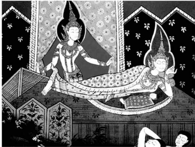
มหาภิเนษกรมณ์ (การเสด็จออกผนวช)

ในการเสด็จประพาสพระราชอุทยาน ๔ ครั้ง ได้ทอดพระเนตรเห็น คนแก่ คนเจ็บ คนตาย และนักบวช โดยลำดับ ทำให้เจ้าชาย ทรงเมื่อนำยต่อสิ่งที่ปัจจัยปรุงแต่งทั้งหลาย