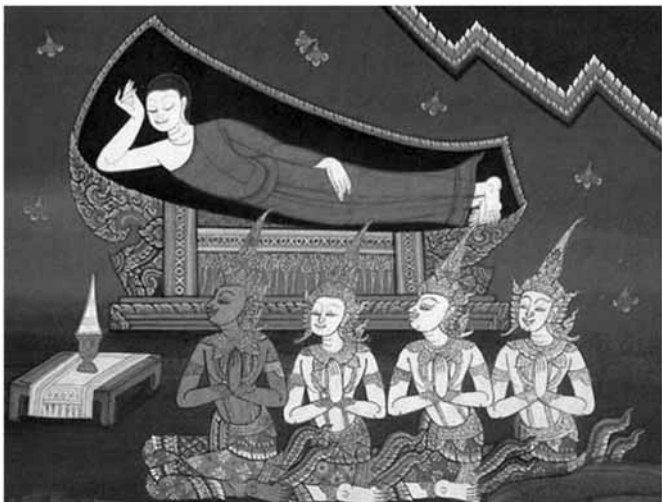
พระราหุลบรรลุความเป็นพระอรหันต์ พระราหุล โอรสของพระศาสดา ทรงได้รับอนุญาตให้บรรพชา เป็นสามเณรพระองค์แรก และต่อมาได้อุปสมบทเป็นพระภิกษุ ท่านมีความกระตือรือร้นในการศึกษาและฝึกอบรมแรงกล้า จึงได้บรรลุความเป็นพระอรหันต์ คือสภาพที่เป็นอิสระจากกิเลส (ความชั่วที่ทำจิตใจให้เศร้าหมอง) ทั้งปวง