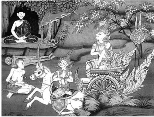
เสด็จประพาสพระราชอุทยาน

ในการเสด็จประพาสพระราชอุทยาน ๔ ครั้ง ได้ทอดพระเนตรเห็น คนแก่ คนเจ็บ คนตาย และนักบวช โดยลำดับ ทำให้เจ้าชาย ทรงเมื่อนำยต่อสิ่งที่ปัจจัยปรุงแต่งทั้งหลาย