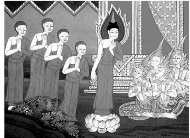
เสด็จสู่กรุงกบิลพัสดุ์

เสด็จไปสู่ป่าอิสิปตนะ พระพุทธเจ้าทรงแสดงพระปฐมเทศนาแก่ภิกษุเบญจวัคคีย์ (กลุ่มภิกษุ ๕ รูป) และภิกษุรูปหนึ่งในจำนวนนั้น คือ พระอัญญาโกณฑัญญะ ได้ดวงตาเห็นธรรม ในวันอาสาฬหบูชา