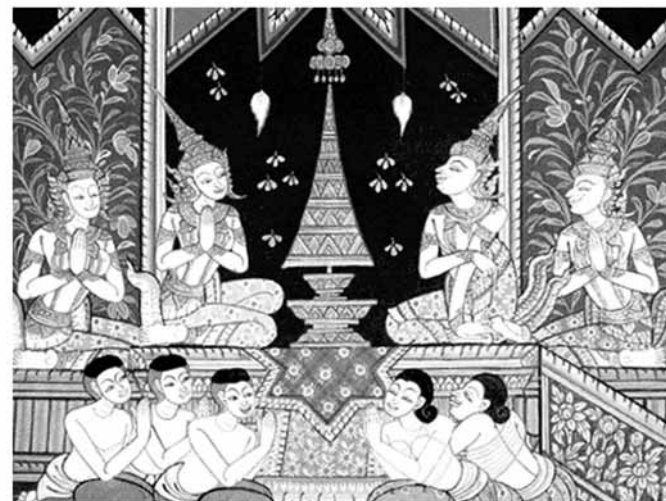
เจ้าชายทรงอภิเษกสมรส

พระนางมหายาประสูติเจ้าชายลิทัตตะ ณ อุทยานลุมพินี ในวันวิสาขปุณณมี ๘๐ ปี ก่อนพุทธศักราช