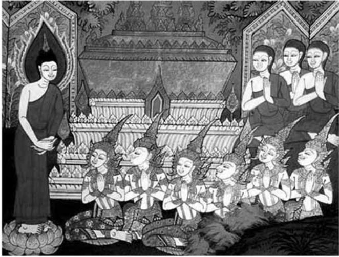
ถวายพระเพลิงพระบรมศพพระพุทธบิดา พระพุทธเจ้า พร้อมด้วยพระสาวก ทรงจัดการถวายพระเพลิง พระบรมศพพระเจ้าสุทโธทนะ