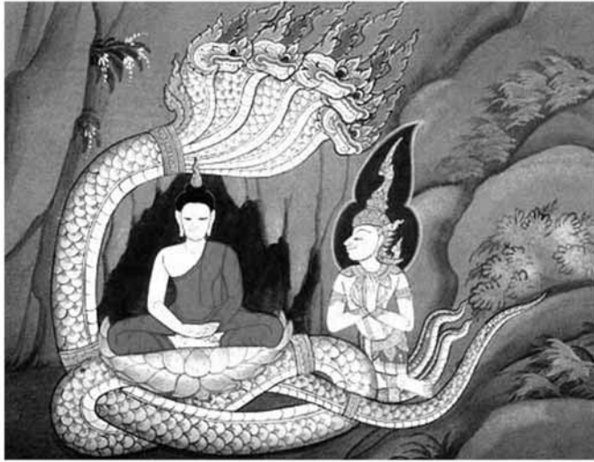
พญานาค ชื่อมจลินท์

ภายใต้ต้นมจลินท์ หรือต้นจิก มีพญานาคชื่อ มจลินท์ มาถวายอารักขา ป้องกันพระองค์จากฝนและลมหนาว